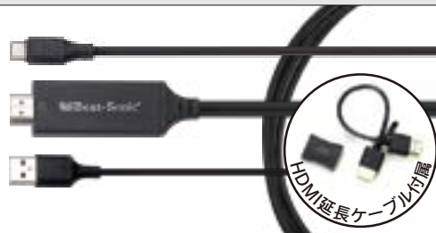
HDMI延長ケーブル付属