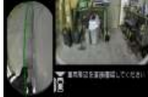
②マルチビュー (フロント+サイド)