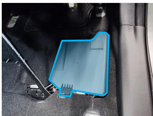
純正アンプのカバー