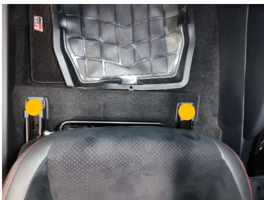
シート前方の画像

助手席シートレールのボルトが前方2か所、後方2か所の合計4か所あるので、すべて外す。(オレンジ○位置)