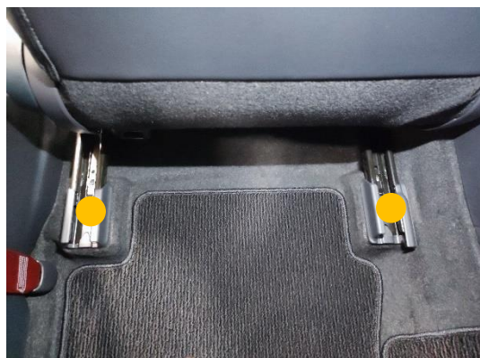
シート後方の画像